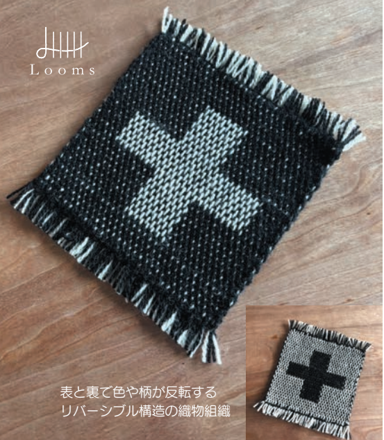
表と裏で色や柄が反転する リバーシブル構造の織物組織