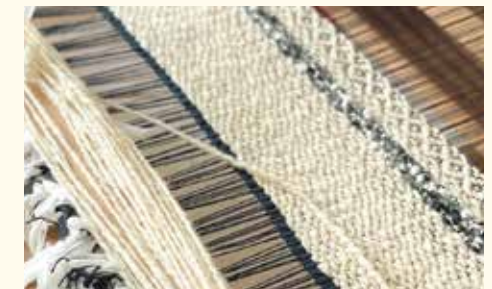
写真はイメージ。実際に制作するデザインとは異なります。

ヨコ糸にざっくり太いウール糸を使い、羊毛を織り込んだ平織ラグマットをつくりまします。ベッドサイドのスリッパ敷きなどに嬉しい大きめサイズです。/受講料10,000円(材料費込み)