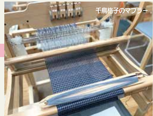
千鳥格子のマフラー

玉ねぎ染めの基本を学ぶ3日間。ミョウバン媒染と銅媒染の2色を染めます。/受講料 20,000円(羊毛100g、染料等含む)/持ち物 エプロン