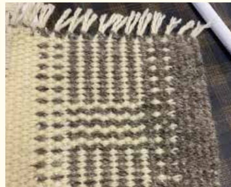
写真はイメージ。実際に制作するデザインとは異なります。