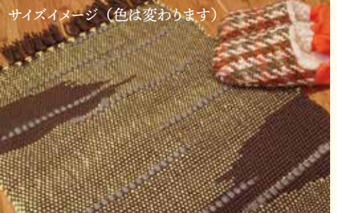
サイズイメージ(色は変わります)